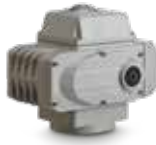
3770 ELEKTRİKLİ AKTÜATÖR