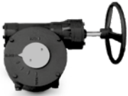
3700 DİŞLİ KUTUSU