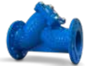
2500 Y-TİPİ PISLİK TUTUCU