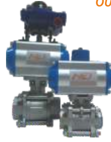
PNÖMATİK KÜRESEL VANALAR PNEUMATIC BALL VALVE