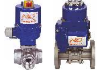
ELEKTRİK MOTORLU KÜRESEL VANALAR ELECTRIC MOTOR BALL VALVE