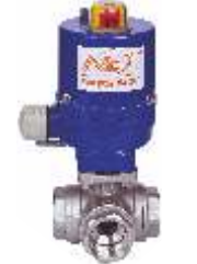
ELEKTRİK MOTORLU KÜRESEL VANALAR ELECTRIC MOTOR BALL VALVE