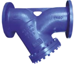
Boşaltım Tapası Piring Paslanmaz çelik Filtre