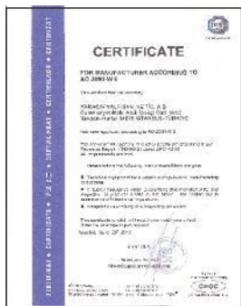
AD 2000 - W 0 İMALAT YETERLİLİK BELGESİ