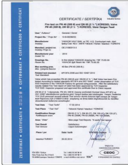
FIRE SAFE KÜRESEL VANALAR-ÇELİK