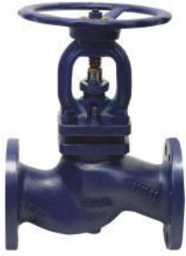
İç Aksamı Komple Paslanmaz