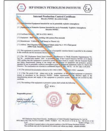
ATEX 94/9/EC the article 8.1b(ii)