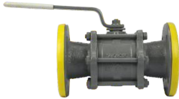
Tabak Yay Takviyeli İçİ Dolu Paslanmaz Küreli