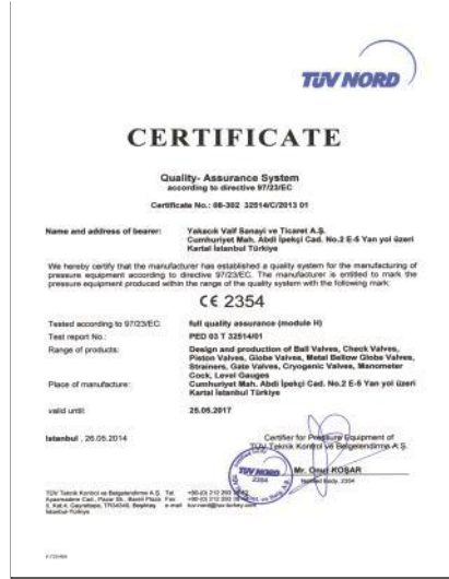
CE 2354 PED 97/23 EC / KATEGORİ III