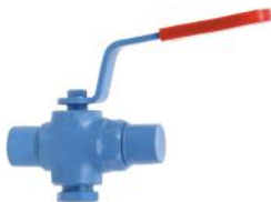
Dövme Çelik 2 ve 3 yollu +250 °C den sonra KAF ring kullanılır.