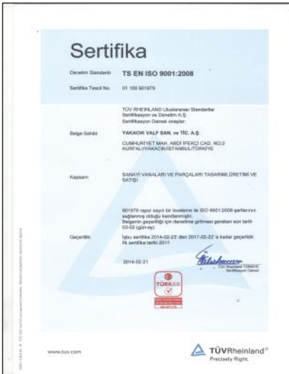
ISO 9001-2008 KALİTE YÖNETİM SİSTEMİ