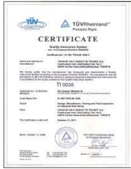
TPED 99 36 TAŞINABİLİR BAS. KAPLAR