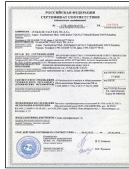
GOST BÜTÜN ÜRÜNLER