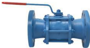
Tabak Yay Takviyeli İçİ Dolu Paslanmaz Küreli