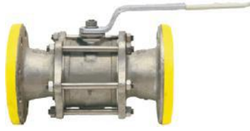
Tabak Yay Takviyeli İçİ Dolu Paslanmaz Küreli