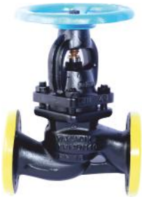
İç Aksamı Komple Paslanmaz