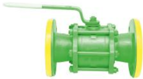
Tabak Yay Takviyeli İçİ Dolu Paslanmaz Küreli