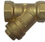
Pirinç Gövde Pirinç Kapak Paslanmaz Çelik Filtre