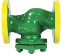
Paslanmaz Çelik Filtre