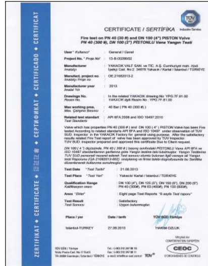
FIRE SAFE PİSTONLU VANALAR-ÇELİK