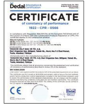
FIRE HYDRANT 1922 - CPR - 0566