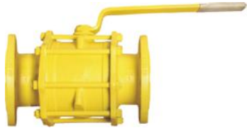
Tabak Yay Takviyeli İçİ Dolu Paslanmaz Küreli